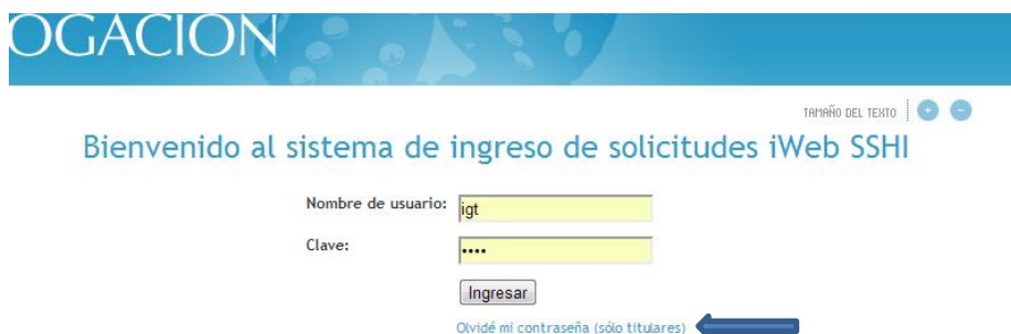
Figura 11: Recuperación de clave