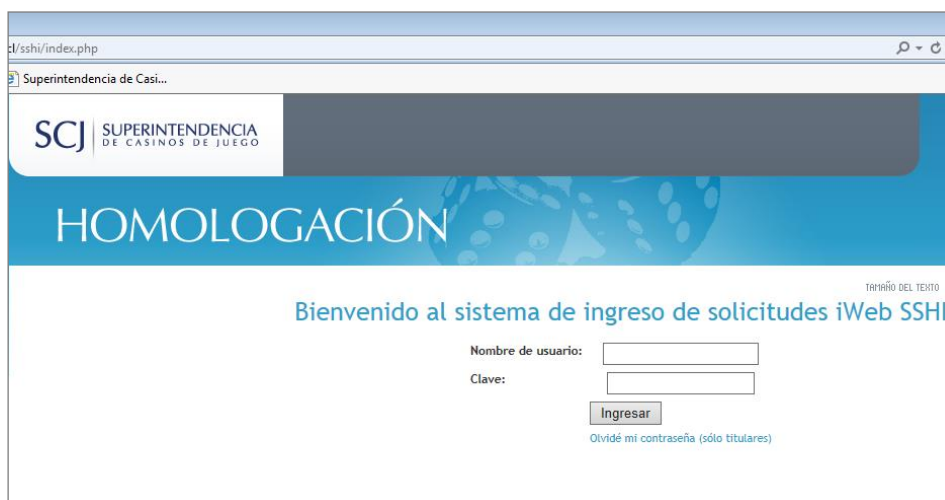
Figura 1: Ingreso al sistema

La siguiente figura muestra la página web de esta Superintendencia, que contiene la ventana emergente donde el usuario se deberá autenticar para ingresar al sistema iWeb SSHI.