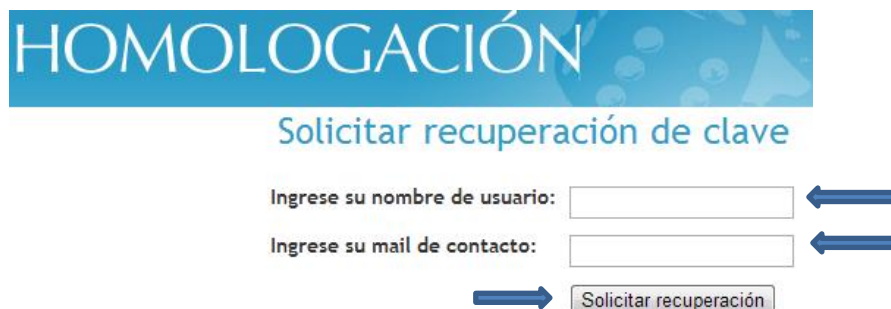
Figura 12: Solicitar recuperación de clave

Con esta acción, se enviará un correo al e-mail de contacto registrado, con las instrucciones para continuar con la recuperación de la clave.