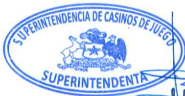
VIVIEN VILLAGRÁN ACUÑA SUPERINTENDENTA DE CASINOS DE JUEGO

ANÓTESE, NOTIFÍQUESE, PUBLÍQUESE Y ARCHÍVESE