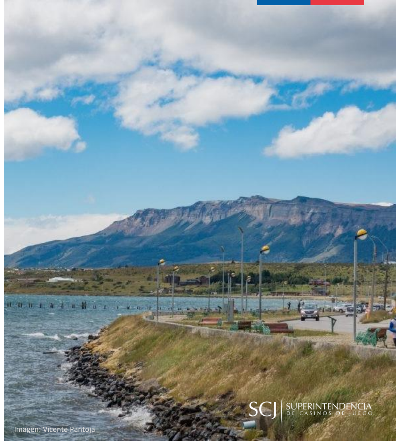
Imagen: Vicente Pantoja